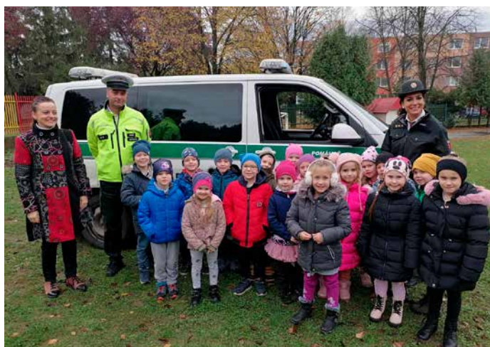
Mravčekom na besede s dopravnými policajtmi.

Ostatné triedy pozývajú rodičov na Vianočné besiedky do svojich tried, kde im predvedú