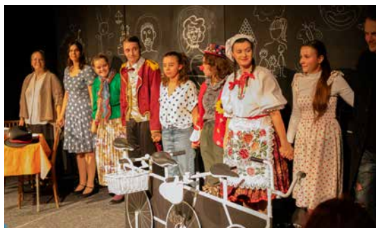
Divadlo Mladých šesť Pé Partizánske

ne. Večer spríjemnil hudobný koncert kapely God bless dumplings, no počas dní prebiehali aj vzdelávacie aktivity, divadelný kvíz a semi-