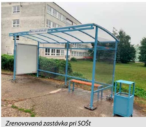
Zrenovaná zastávka pri SOŠt

konca roka Služby mesta Tlmače vybudovali 8 spevnených plôch, na ktorých sú aktuálne umiestnené kontajnery a pravdepodobne v budúcom roku budú na nich osadené uzamykateľné stojiská. V tomto roku sme ukončili aj vypracovanie projektovej dokumentácie na všetky spevnené plochy pod kontajneriská v meste, ktoré postupne dobudujeme. V rámci takzvane menších prác sa nám v meste podarilo zmodernizovať všetky autobusové zastávky. Nový šat dostala autobusová stanica na Lipníku, vymenili sme autobusové zastávky pri „učilišti“ SOŠt, na Tekovskej ulici. Čo nás však mrzí, že neprešiel čas a autobusovú stanicu poznačili vandali-sprejeri. Snáď aj tomuto bude koniec. Financie sme alokovali na kúpu fotopascí a rozšírenie kamerového systému. Bežné finančné prostriedky sme tento rok venovali aj na modernizá-