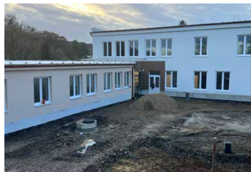
Denný stacionár s novou fasádou

rekonštrukcie objektu bývalej „šampusárne“ na Topoľovej ulici, ktorý z externých zdrojov ukrojil prakticky 2 milióny eur, je aktuálne pred bránami dokončenia. Sme veľmi hrdí na to, ako sa nám tento dlhodobu nevyužitý objekt podarilo zrekonštruovať, modernizovať a dať mu nový život a nové poslanie. Veríme, že v roku 2024 v dennom stacionári už budeme môcť poskytovať