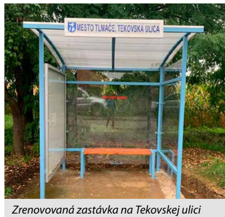
Zrenovaná zastávka na Tekovskej ulici

nych daniach za nehnuteľnosti a taktiež v poplatku za odpad, tieto financie sa však priamo odzrkadlia v činnosti pre mesto a v zachovaní hlavných činností dôležitých pre jeho nevyhnutný chod v časoch, kedy samosprávy a teda aj občania, nie sú prioritou pre našu vládu.