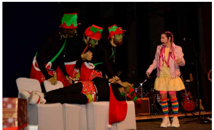
God Bless Dumplings s Dúhalkou