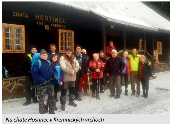
Na chate Hostinec v Kremnických vrchoch

kolená cez lúky s peknými výhľadmi na pohorie Vtáčnik, Veľkú Fatru, Nízke Tatry na chatu pod Veľkým Inovcom a ďalej až