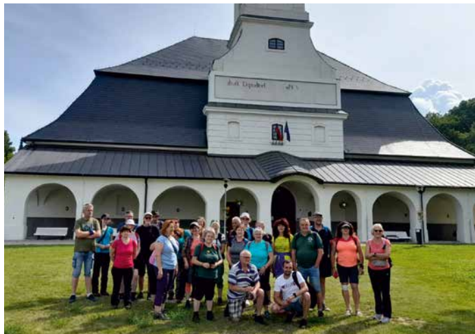
TTT Pred Solivárom v Prešove

kátnych Slovenských opálových baní, po prehliadke bane po červenej na vrch Šimonka, koniec túry v Zlatej bani pri dreve- (Pokračovanie na str. 20)