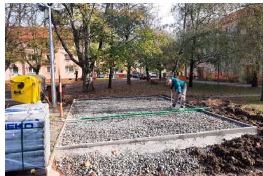
Výstavba spevnených plôch pre kontajnery

cie dolnej materskej školy. Vynovili sme sociálne zariadenia, či podlahy v triedach a chodbe. Na budúci rok zatiaľ nemáme stanovené priority rozvoja mesta. Dôvod je vážny. Štátny rozpočet pracuje s negatívnymi číslami, s vysokou infláciou a vysokým deficitom. Táto skutočnosť má za následok, že mestský rozpočet a nielen náš, ale prakticky všetkých samospráv, postihne problém na úrovni nižších finančných vstupov. Očakávame nižšie podielové dane od štátu, no na druhej strane zaťa-