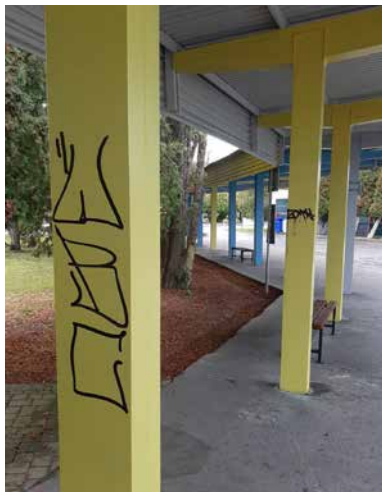
Vandalizmus - sprejeri na autobusovej stanici

Na to, aby sme v meste mohli vykonávať akékoľvek stavebné zmeny, či rozvojové aktivity, mesto musí mať k dispozícii aktuálnu územnoplánovacia dokumentáciu. Dlhodobu na nej pracujeme. Momentálne sa nachádzame vo fáze spracovania koncepcie. Je to fáza, v ktorej sa graficky definujú jednotlivé územia v meste, fixujeme ich účel a budúce využitie. Mesto Tlmače má druhý najmenší kataster v okrese a preto je jeho využiteľnosť kľúčová. Je potrebné myslieť a sklbiť fakt, že máme v meste vysoký úbytok obyvateľstva a treba hľadať priestor na možnú individuálnu, či hromadnú bytovú výstavbu, čím si zabezpečíme vyšší počet obyvateľov. S tým je neodmysliteľne spojená občianska vybavenosť,