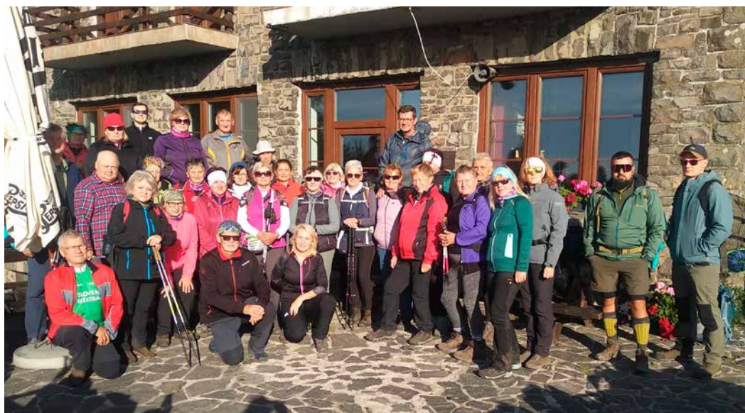
Účastníci akcie Csoványos v Maďarsku