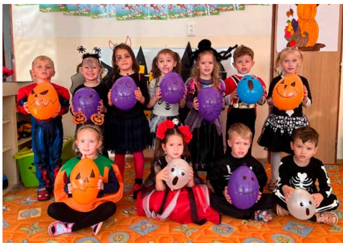
Trieda Lienok na Halloween

V septembri sme sa po letných prázdninách opäť stretli v Materskej škole v triede Lienok, Veveričiek, Hrošíkov a Mravčekom. Hrošíky sú naše najmenšie ratolesti a tešíme sa, že sa všetky adaptovali a tešia sa na nové zážitky so svojimi kamarátmi.