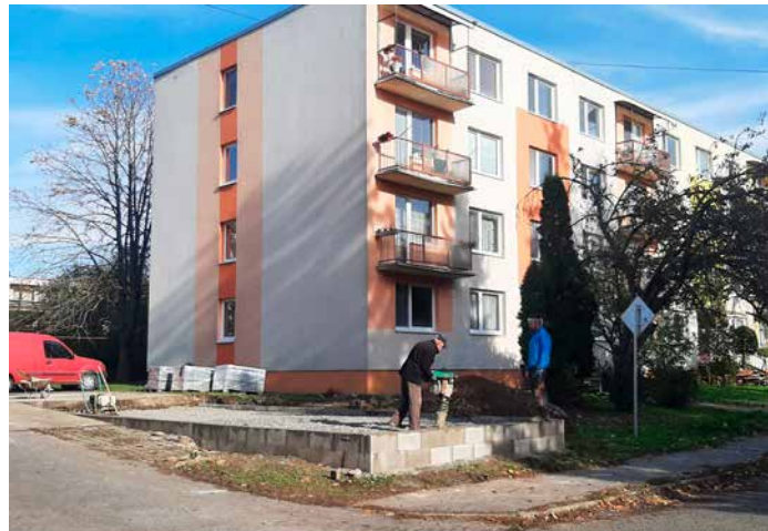
Výstavba spevnených plôch pre kontajnery

dostatok zelených plôch, ako aj plôch na voľnočasové využitie. Na pôde volených orgánov prebieha debata o koncepcii parkovania, nutnosti vyriešiť problém narastajúceho počtu áut a chýbajúcich parkovacích miest. Rovnako tak prebieha realizácia koncepcie odpadového hospodárstva spojená s výstavbou spevnených plôch, na ktorých budú osadené uzamykateľné stojiská. Do