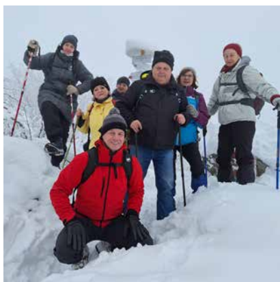
Mikuláš na Inovci, 9.12. 2023

doviezlo 33 účastníkov k Dunaju do dedinky Kismaros. A odtiaľ autobusom domov.