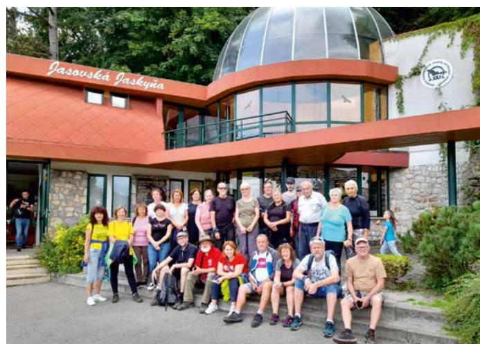
TTT Pred Jasovskou jaskyňou