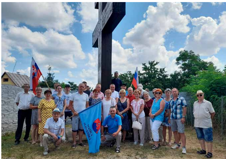
Slávnosť sv. Cyrila a Metoda, účastníci vychádzky k slovenskému dvojkrížu