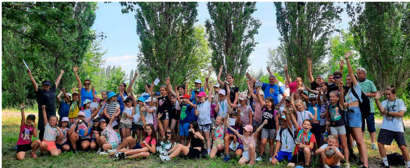
Účastníci Detského tábora, 11.7.2023