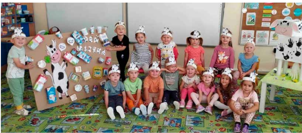
Deň mlieka Veveričky

V triede novoprijatých detičiek prebehli Imatrikulácie a Hrošíky boli prijaté do radov