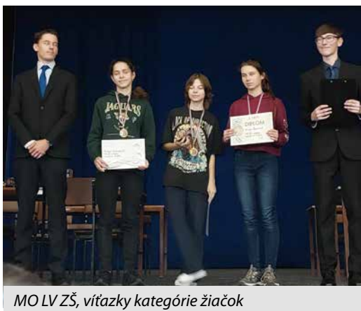
MO LV ZŠ, víťazky kategórie žiačok