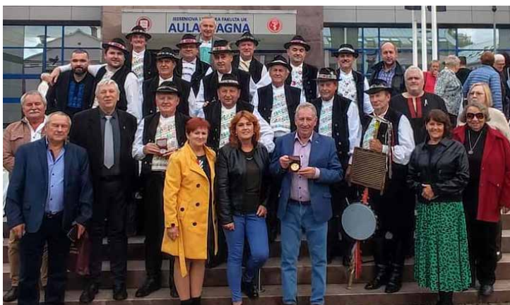
Zástupcovia okresu Levice na Sneme MS v Martine

V sobotu 2. septembra 2023 sa skupina matičiarov z Tlmáč zúčastnila na XXXI. ročníku turistického a vlastivedného podujatia Národný výstup na Pustý hrad . Program na Pustom hrade odštartoval o 10.00 pozdravom účastníkov Cyklojazdy histórie. Okrem známej hudobnej skupiny HRDZA sa predstavili sokoliari sv. Bavo-