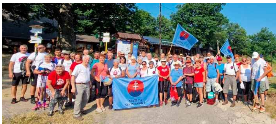
Národný výstup na Sitno

MS ako sú Tlmače, Rybník, Veľké Kozmálovce, ale aj spoluorganizátori podujatia zo Štiavnických Baní a Žarnovice sa postarali o zdarný priebeh podujatia. Matičiarci nezabúdajú na našu históriu, pripomínajú si ju výstupom na Sitno každý rok. A pre tých, ktorí si už na výstup netrúfajú, vždy pripraví program pri Počúvadlianskom jazere. Zárukou dobrej zábavy je tradične spevácka skupina Veselí chlapi. Slovenská ľudová pieseň a dobrá nálada účastníkov sa tak šíri i na náhodných okoloidúcich.