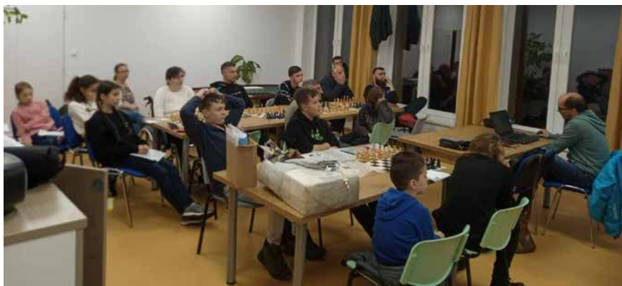
Tréning v komunitnom centre na Lipníku