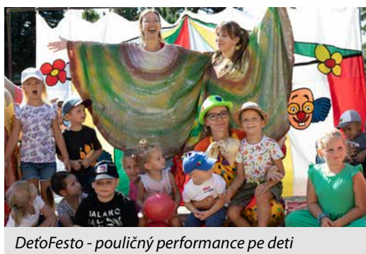
DeťoFesto - pouličný performance pre deti