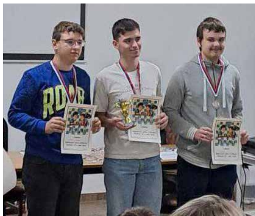
MO ZM SŠ, víťazi kategórie študentov