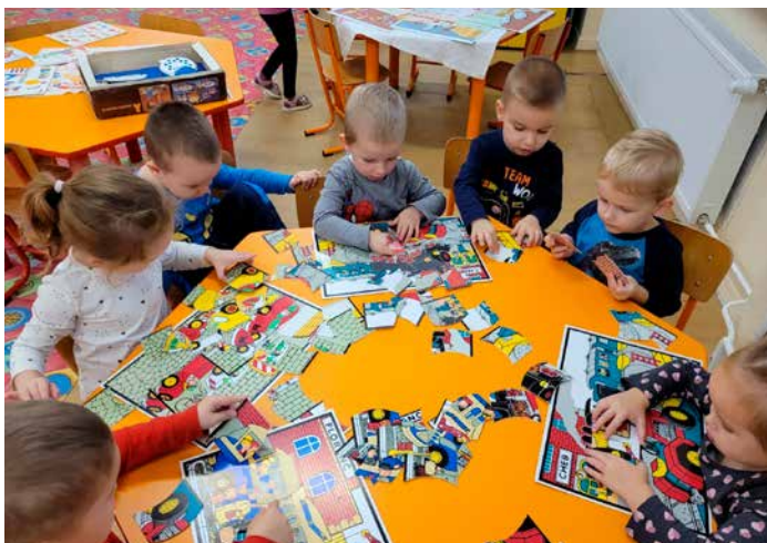
Retro deň v triede Hrošíkov