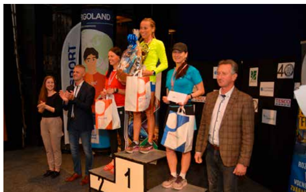
Absolútni víťazi v kategórii ženy