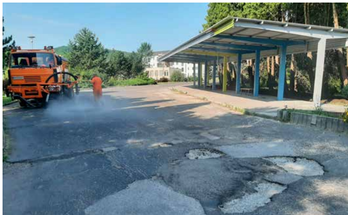
Rekonštrukcia autobusovej stanice na Lipníku

V treťom májovom týždni zamestnanci SMT, p. o. uskutočnili tiež výsadbu nových stromov na ulici Dlhej – jaseň