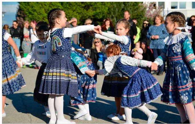
Detský folklórny súbor Plamienok pri stavaní mája – mladšia zložka

nia, zrazu sme mali okolo 30 detí, čo bolo skvelé. Začali sme teda pracovať s deťmi v družine a väčšina bola už aj aktívnymi členmi DFS. Začali sme tvoriť program a za pomoci MsKS sme boli úspešní v podaní grantu na prípravu „celovečerného“ predstavenia pod názvom „Tak si ja tancujem“. Práca v súbore pokračovala a prišlo to, čo sme si mysleli, že našu krajinu obide, a to bol koronavírus. Neustále obmedzovania, zatváranie všetkého, prísne zákazy stretávania sa si vyžiadali svoju daň aj v súboroch. Zostalo nám približne 10 dievčat. Po zrušení obmedzení sme opäť začali trénovať, ale keďže sme mali doma dve malé deti, nácviky sme viac rušili, ako sme trénovali. Po čase sme sa rozhodli, že skúsime vytvoriť ďalšiu skupinu a začali sme naberať deti vo veku od 3 rokov. Toho času nám fungujú 2 skupiny a do-