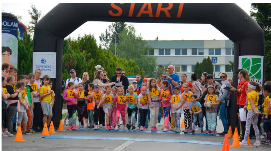
Štart detí na Tlmačskom polmaratóne