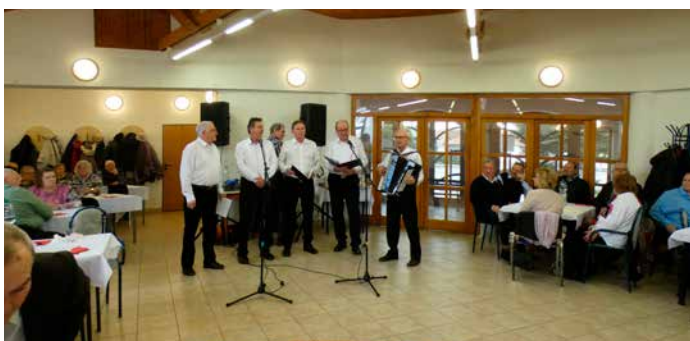
Fašiangová zábava v kultúrnom dome v dolnej časti mesta