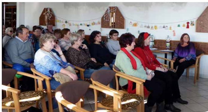
Stretnutie členov Jednoty dôchodcov

nočasové centrum, kde sa môžu schádzať počas pracovných dní každé popoludnie. Tlmačskí seniori už tradične organizujú pre deti pri príležitosti stavania mája maľovanie na asfalt. Spolu so SZPB sa zúčastňujú na oslavách oslobodenia a výročia SNP. Pre svojich členov organizujú návštevy divadiel. Na okresnom športovom dni v Rybníku Tlmačania získali 9 medailí. Mužská spevácka skupina si na okresnej súťaži vybojovala postup na krajskú súťaž, ktorá sa uskutoční v tomto roku. Vydarila sa aj celookresná akcia – výlet okolo Vodného diela Koz-