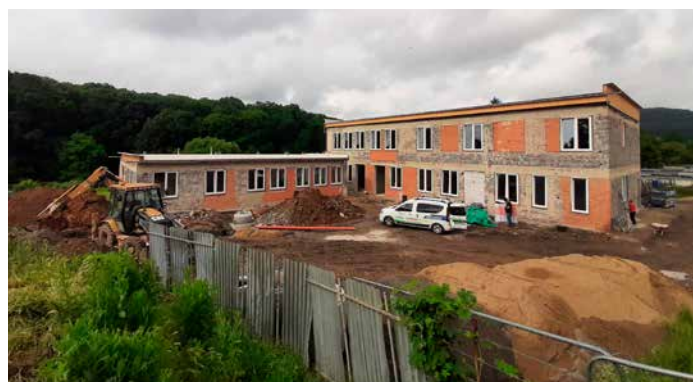
Rekonštrukcia budovy – denný stacionár

dy vnútorných inštalácií a iné. V objekte bude kuchyňa, jedáleň, relaxačné priestory. Pre našich seniorov to bude niečo, čo