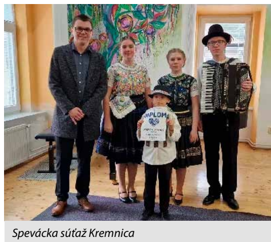
Spevácka súťaž Kremnica

Želaním pedagógov, ale aj celého vedenia ZUŠ je, aby triedy našej školy mali stále taký vysoký počet šikovných a nadaných žiakov. V dnešnej spoločnosti je cenné, že mnohí rodičia naďalej chápu zmysel u umeleckého vzdelávania a výchovy. Vďaka ich dôvere môžeme umením vplývať na rozvoj