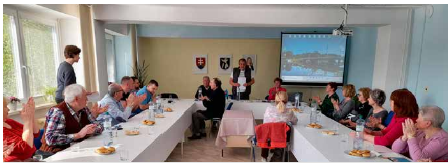
Výročná schôdza členov MO MS

ročníku Národného výstupu na Sitno. Ďalej to bola účasť na Matičných slávnostiach v Rybníku na Teplíci a folklórnom festivale Tlmačská grámora. V sobotu 3. septembra sa sedemnást matičiarov a členov KST Tlmače zúčastnilo na XXX. ročníku turistického a vlastivedného