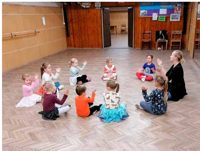
DFS Plamienok pri nácviku