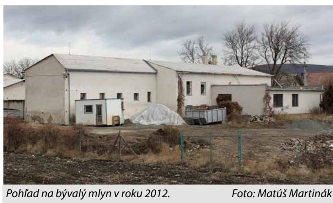
Pohľad na bývalý mlyn v roku 2012.