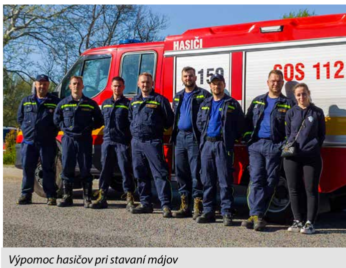
Výpomoc hasičov pri stavaní májov

Máj priniesol už tradičné podujatia, ktorými sú stavenie májov a Tlmačský polmaratón. Naši hasiči si na týchto mestských podujatiach plnia funkciu hasičského dozoru a vypomáhajú organizátorom s rôznymi prácami potrebnými pre hladký priebeh podujatí. V máji sme sa zúčastnili územnej súťaže (okres Levice), ktorá sa konala v Mýtnych Ludanoch. Súťažilo sa v disciplínach štafeta, požiarneho útoku a prebor jednotlivca. V štafete dosiahli naši hasiči čas 79,54 s a v požiarnom útoku čas 17,18 s. V súčte oboch časov (96,72 s) dosiahli tlmačskí hasiči krásne 2. miesto za víťaznými Kozárovcami. Rozdiel časov medzi 1. a 2. miestom bol len 1,5 sekundy. Na krajskej súťaži budú teda reprezentovať okres Levice hasi-