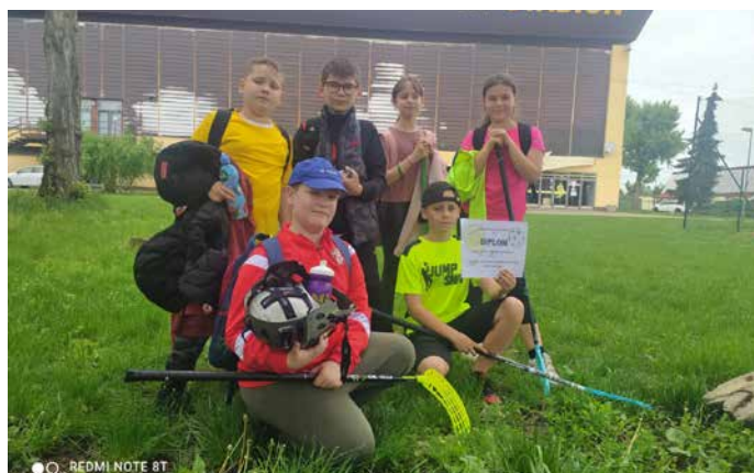
Florbalový turnaj mladších žiakov v Leviciach