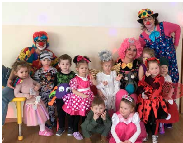
Karneval v triede Veveričiek

Druhá májová nedeľa bola venovaná našim mamičkám. Trieda Levíkov a Mravčekom si pripravili krásne hudobno-tanečné programy, s ktorými vystúpili v Kultúrnom dome pri príležitosti osláv Dňa matiek . Veveričky mali svoj program v triede a Lienky svoje vystúpenie ku Dňu matiek museli zrušiť pre vysokú chorobnosť.