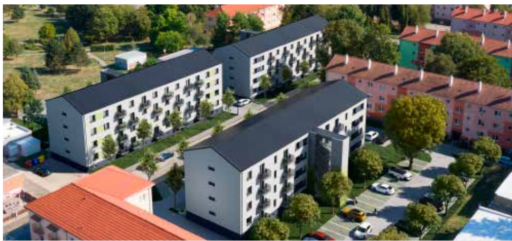
Rekonštrukcia slobodárok – „Nový Lipník“

V neposlednom rade chceme spomenúť mestský mobiliár, najmä lavičky a smetné koše, ktoré sú poškodené, mnohé nefunkčné a aj nebezpečné. Mesto a jeho volení predstavitelia sa preto roz-