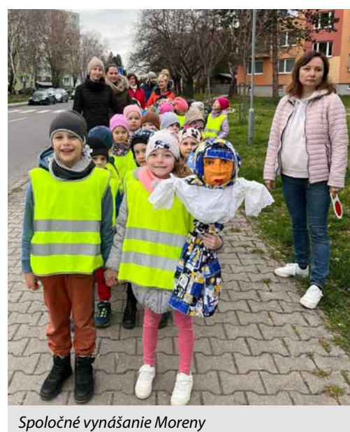
Spoločné vynášanie Moreny