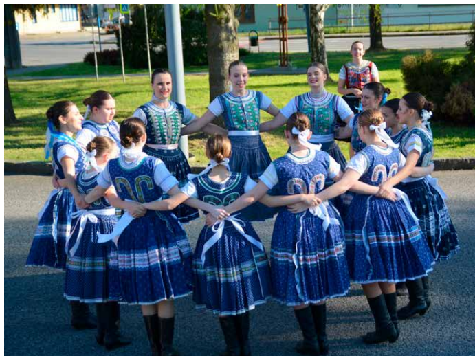
Detský folklórny súbor Plamienok pri stavaní mája – staršia zložka