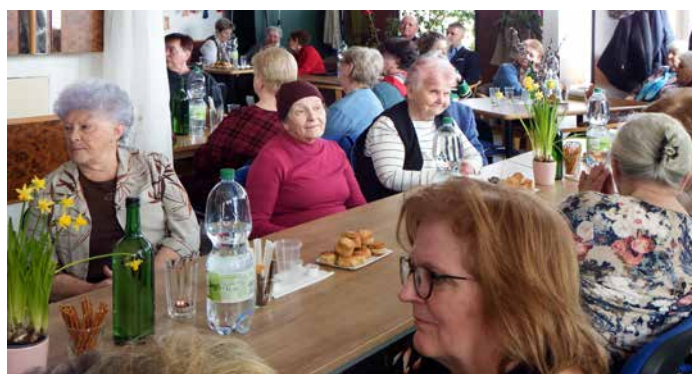
Posedenie tlmačských senioriek pri príležitosti MDŽ