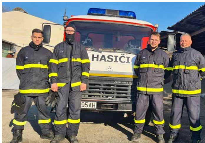
Previerkové cvičenie DHZ Tlmače