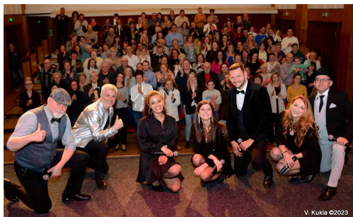
Koncert skupiny Fragile v kultúrnom dome