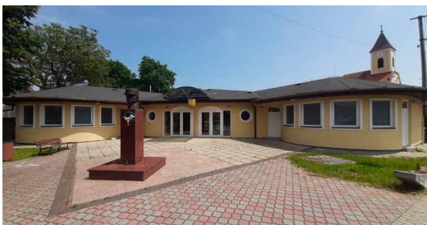
Kultúrny dom po výmene okien a dverí