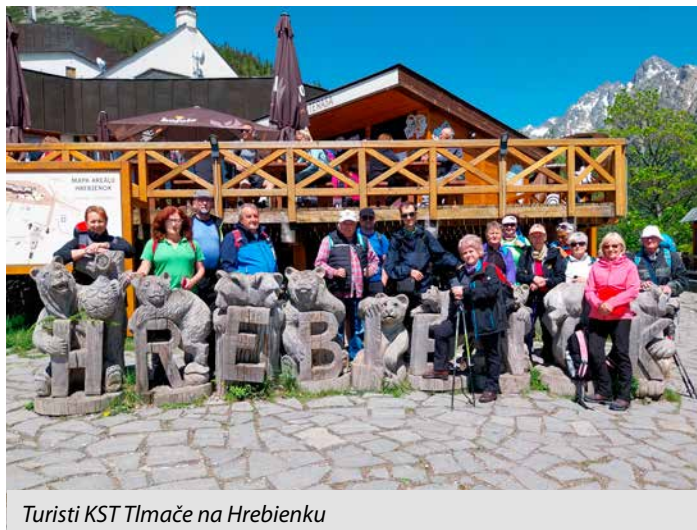
Turisti KST Tlmače na Hrebienku

Naše najbližšie akcie: 7. 7.–9. 7. hrebeňovka v Malej Fatre, od 29. 7.–6. 8. TTT na Šariši, 26. 8. Čertovica a 2. 9. Národný výstup na Pustý hrad.