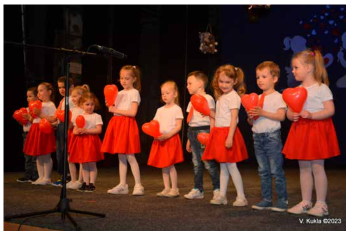
Vystúpenie detí na Deň matiek z MŠ Slniečko

Úctu, lásku a vďaka mamkám sme oslavovali tak ako to už býva, druhú májovú nedeľu. Deň matiek patrí medzi najdojemnejšie sviatky – pre každého človeka je jeho matka najdôležitejším človekom na svete. Aj pre deti z detského folklórneho súboru Plamienok, Materskej školy Lúčik, Materskej školy Slniečko a Základnej školy v Tlmačoch. Pripravili pre svoje mamičky a staré mamy program plný lásky, a aj keď občas vystráňajú a sem tam sú neposedné, tie svoje mamy ľúbia najviac na svete. No aby sme nezabudli, že nie len jeden deň si treba mamu vážiť, pamätajte: Každý chce dnes zachrániť planétu, ale nikto nechce mame pomôcť umyť riad... ☺