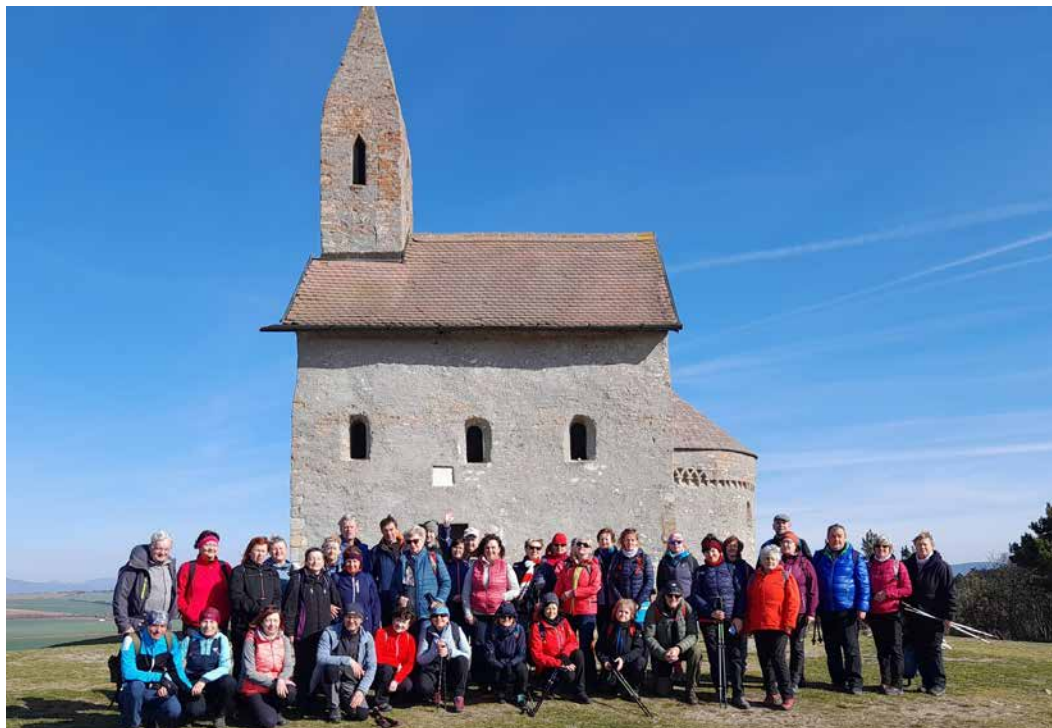
Jozefovská túra pri Dražovskom kostolíku

25. marca skupinka turistov absolvovala prechádzku cyklistickým chodníkom z Čajkova do