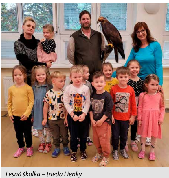
Lesná škôlka – trieda Lienky