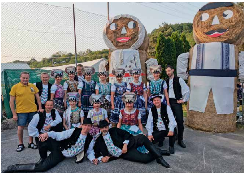
Folklórny súbor Vatra Senior v Bodovke

V rámci programu sme vystúpili na javisku 2 krát v cca 6 minútových blokoch, kde sme