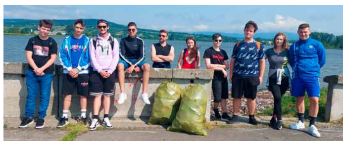
Zber odpadkov na Kozmálovskej priehrade