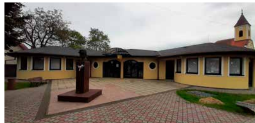
Kultúrny dom - pôvodný stav

v Tlmačoch. Zatiaľ sa nám podarilo z rozpočtu mesta opraviť starú a poškodenú kanalizáciu