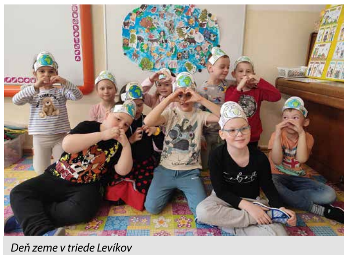
Deň zeme v triede Levíkov