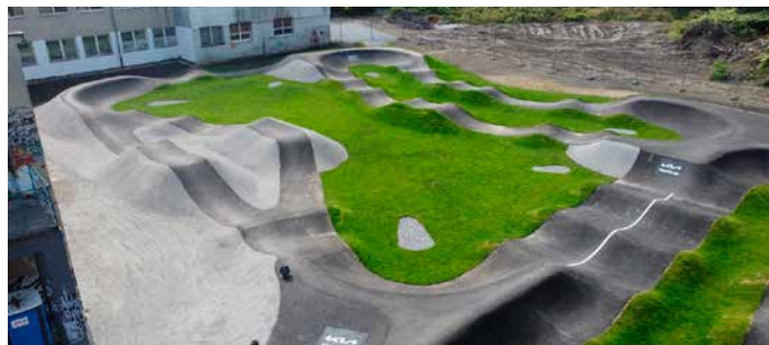
Projekt výstavby pumptrackovej dráhy

Dôležitá informácia pre občanov mesta predovšetkým dolnej časti je posun vo veci dobudovania kanalizácie. Definitívne sme uzavreli variant výstavby pôvodne navrhovanej čističky odpadových vôd, nakoľko sme sa nedohodli s vlastníckmi predmetných parciel. Po mnohých rokovaníach na úrovni vedenia