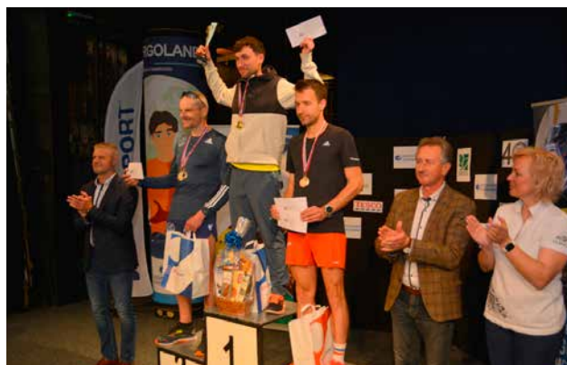
Absolútni víťazi v kategórii muži