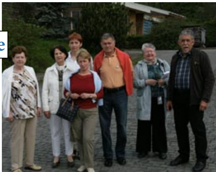
☐ Návšteva francúzskej delegácie v roku 2010

V Saint Just en Chaussée je takmer 70 rôznych asociácií: kultúrne, športové, družobné.